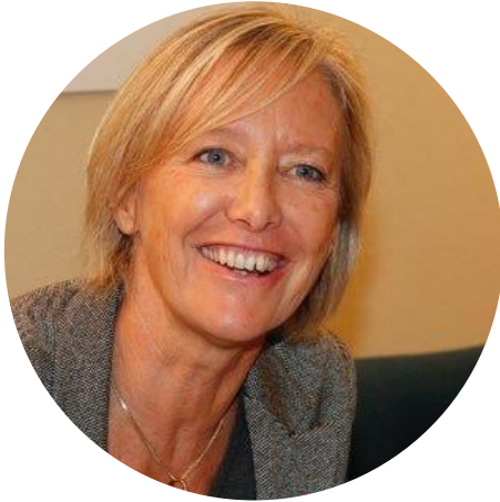
Sophie Cluzel, ancienne secrétaire d'Etat auprès du 1 er Ministre, chargée des personnes handicapées

« L'association se compose de membres actifs, pouvant être des représentants d'entreprises ou d'association ainsi que des deux membres fondateurs. Peuvent s'y adjoindre des membres bienfaiteurs, représentants d'entreprises, d'associations ou personnes physiques, ou des membres d'honneurs, après validation du Conseil d'Administration. Seuls les membres actifs et les deux membres fondateurs disposent du droit de Vote ». (article 5)